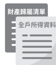
財稅機關所提供最近年度全戶所得資料及財產歸屬清單。