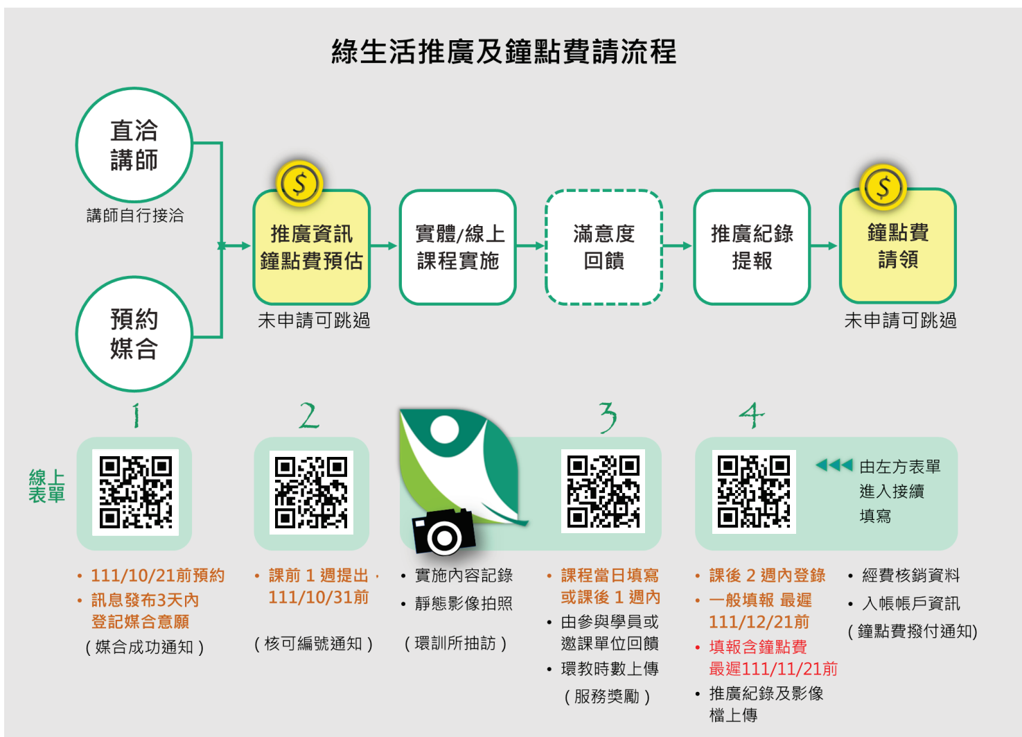
圖 1、綠生活推廣及鐘點請領流程